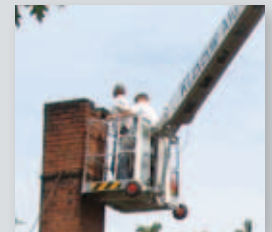
... CLEVER & FLEXIBEL!