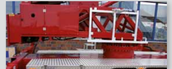
... PRAKTISCH & VARIABEL!