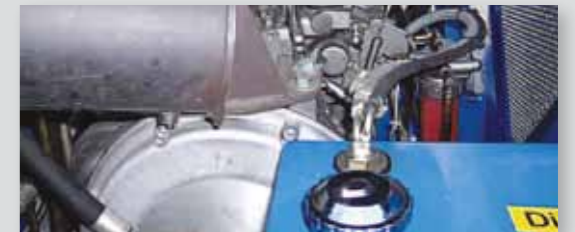
... SPARSAM & UMWELTFREUNDLICH!