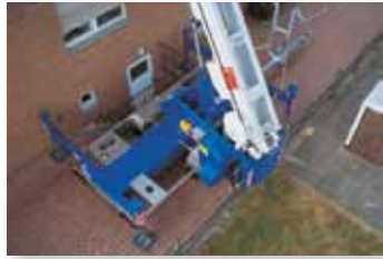
... KOMFORTABEL & SICHER!