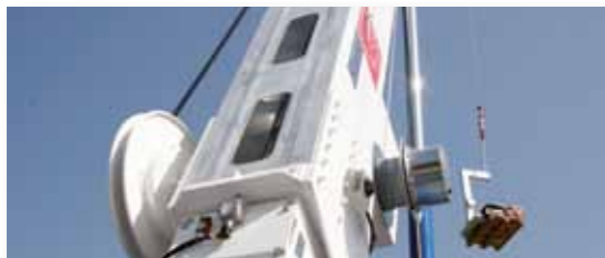
... LEICHT & LEISTUNGSSTARK!