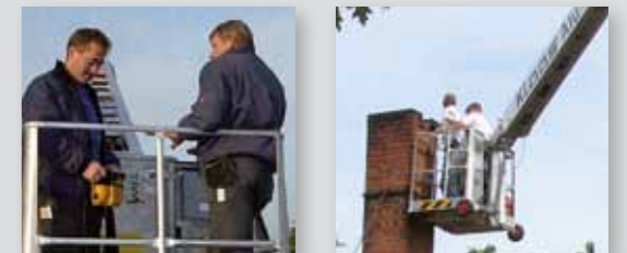
... CLEVER & FLEXIBEL!