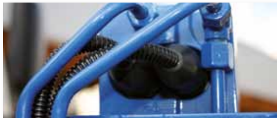
... SICHER & LEISTUNGSSTARK!