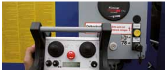
... INTELLIGENT & INNOVATIV!