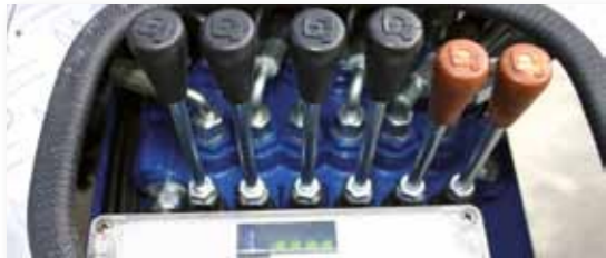
... LEISTUNGSSTARK & FLEXIBEL!