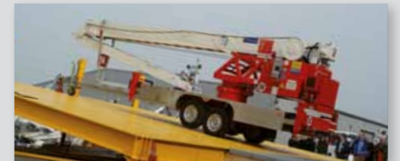
... CLEVER & FLEXIBEL!