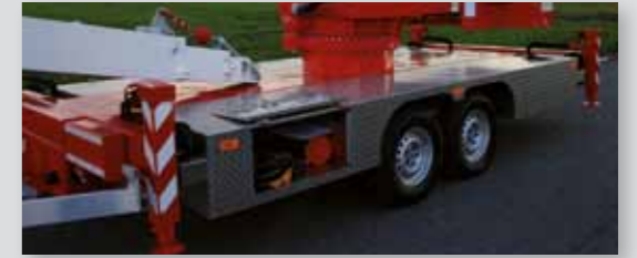
... SICHER & ATTRAKTIV