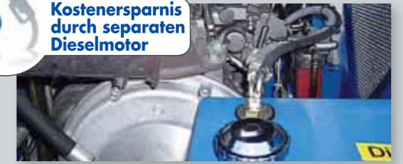
... SPARSAM & UMWELTFREUNDLICH!

Kostenersparnis durch separaten Dieselmotor