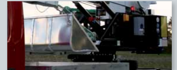
... PRAKTISCH & VARIABEL!