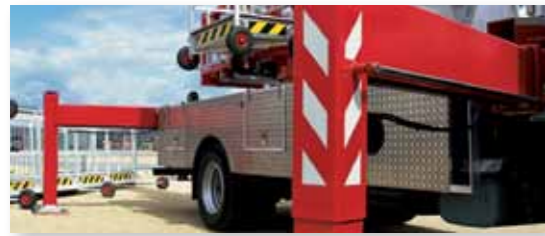
... KOMFORTABEL & SICHER!