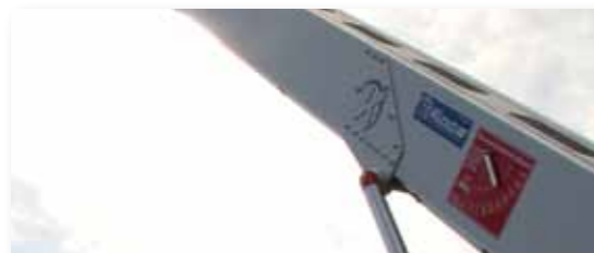
... LEICHT & LEISTUNGSSTARK!