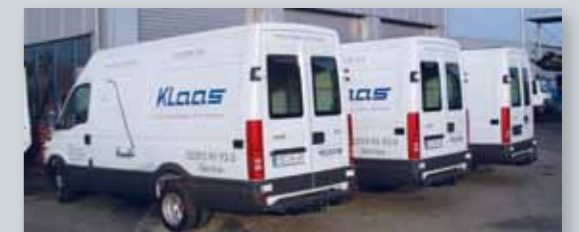
... ZUVERLÄSSIG & KOMPETENT