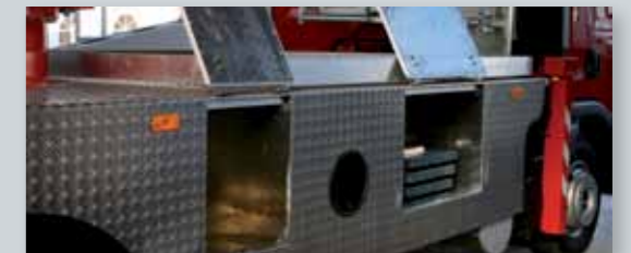
... SICHER & ATTRAKTIV!