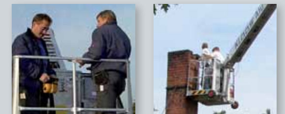
... CLEVER & FLEXIBEL!