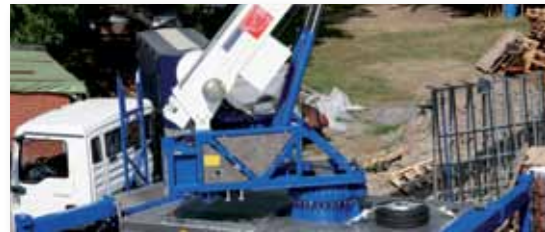
... LEISTUNGSSTARK & FLEXIBEL!