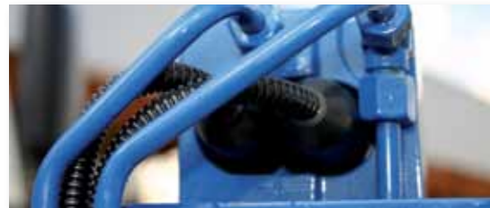
... SICHER & LEISTUNGSSTARK!