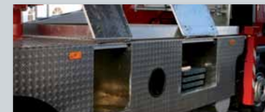
... SICHER & ATTRAKTIV!