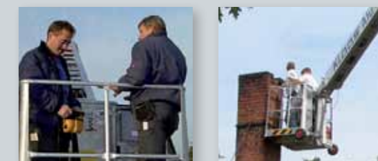
... CLEVER & FLEXIBEL!