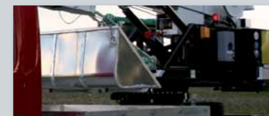
... PRAKTISCH & VARIABEL!