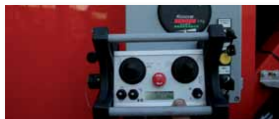
... INTELLIGENT & INNOVATIV!