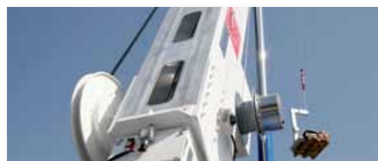
... LEICHT & LEISTUNGSSTARK!