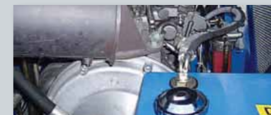
... SPARSAM & UMWELTFREUNDLICH!