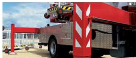
... MASSIV & SICHER!