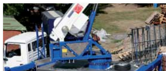
... LEISTUNGSSTARK & FLEXIBEL!