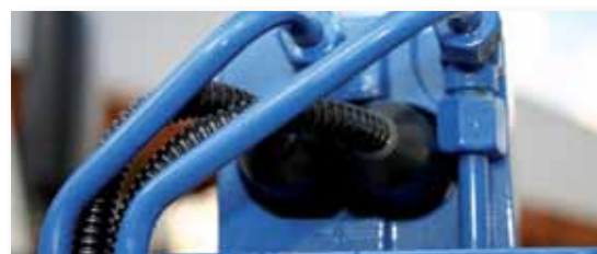
... SICHER & LEISTUNGSSTARK!