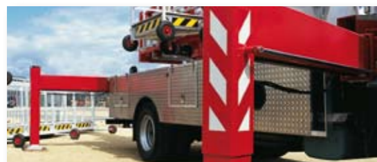
... MASSIV & SICHER!