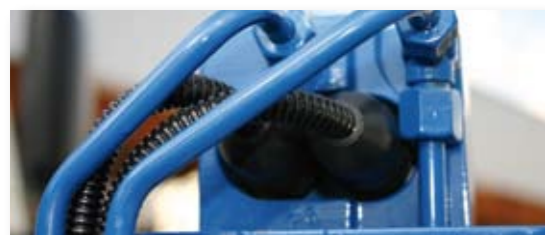
... SICHER & LEISTUNGSSTARK!