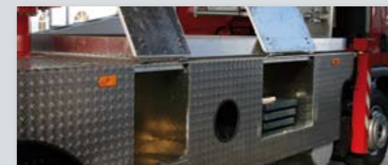
... SICHER & ATTRAKTIV!