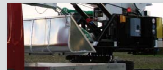
... PRAKTISCH & VARIABEL!