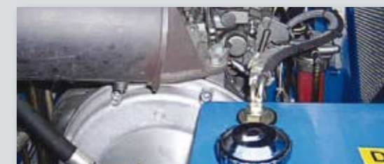
... SPARSAM & UMWELTFREUNDLICH!