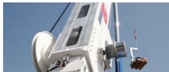
... LEICHT & LEISTUNGSSTARK!