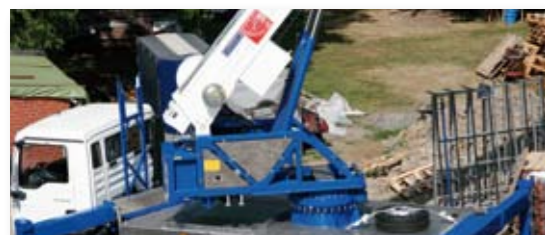
... LEISTUNGSSTARK & FLEXIBEL!