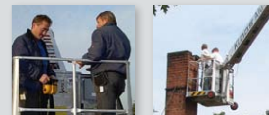
... CLEVER & FLEXIBEL!