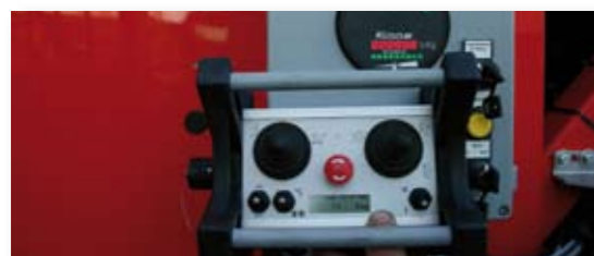
... INTELLIGENT & INNOVATIV!