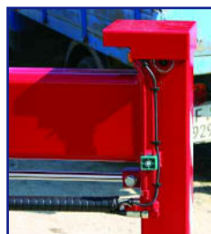
Stütze mit ASC Steuerung