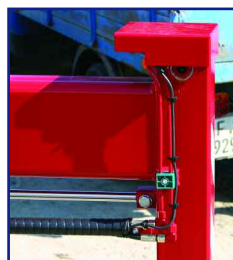
Stütze mit ASC Steuerung