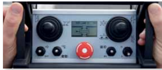
... MASSIV & SICHER!