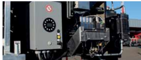
... INTELLIGENT & INNOVATIV!