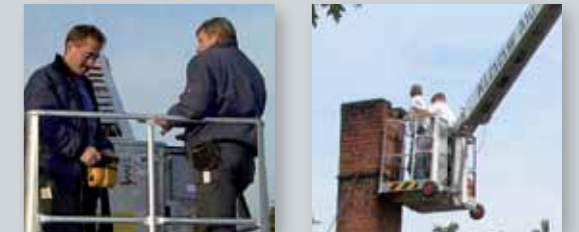
... CLEVER & FLEXIBEL!