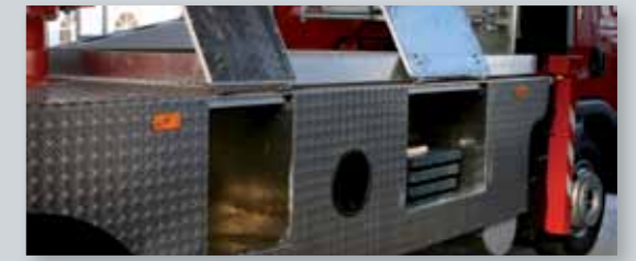
... SICHER & ATTRAKTIV