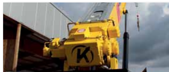
... LEICHT & LEISTUNGSSTARK!