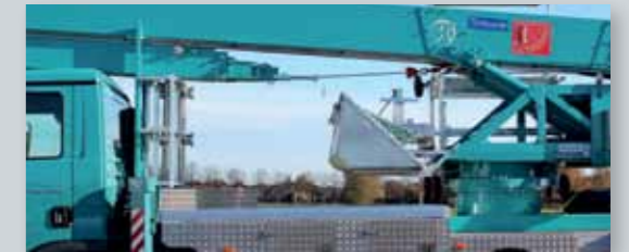
... PRAKTISCH & VARIABEL!