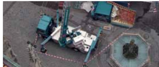
... KOMFORTABEL & SICHER!