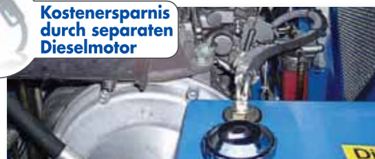
... SPARSAM & UMWELTFREUNDLICH!