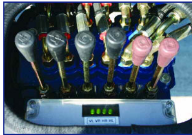
Permanente Überwachung aller sicherheitsrelevanten Funktionen